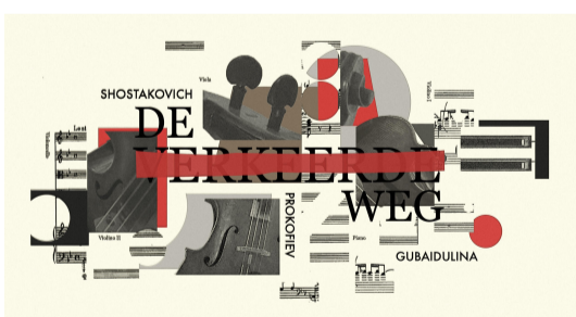
De Verkeerde Weg (beeld Jowan de Haan)