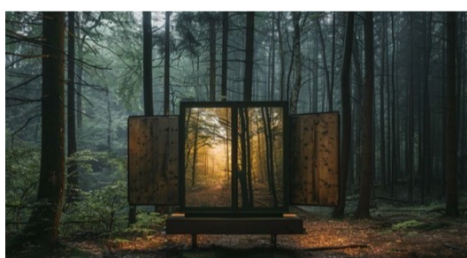
Memories of Trees (installatie Jurjen Alkemade)