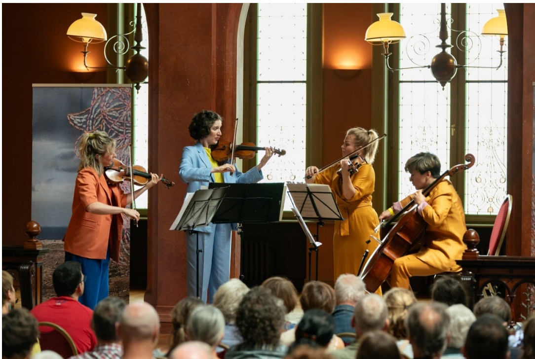
Ragazze Quartet op Walden Festival, 15 juli 2024