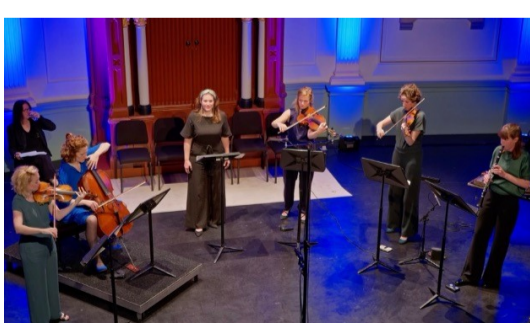
They Have Waited Long Enough